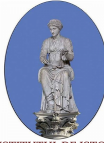
INSTITUTUL DE ISTORIE

Promovarea democrației și a drepturilor omului