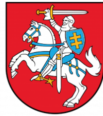
EMBASSY OF THE REPUBLIC OF LITHUANIA TO THE REPUBLIC OF MOLDOVA