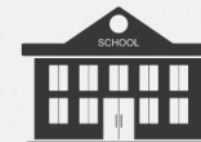
Școala-internat mun. Bender