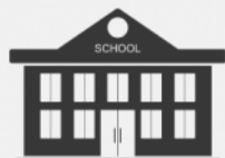
Liceul Teoretic "Mihai Eminescu" or. Dubăsari