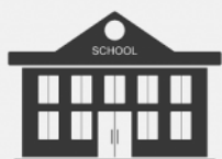
Liceul Teoretic "Lucian Blaga" mun. Tiraspol

Promovarea democrației și a drepturilor omului