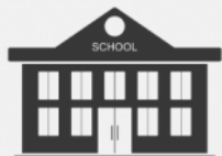
Gimnaziul Roghi s. Roghi